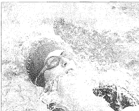
Es herrscht einiges Gedränge im Grafinger Stadtbad, schließlich schwimmen dort mehrere hundert Teilnehmer um Medaillen – und die Kleinsten werden oft von der ganzen Familie begleitet.