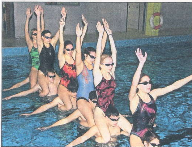
Die Leistungsgruppe 1 bei der Aufführung des Wasserballetts beim Weihnachtsschwimmen.